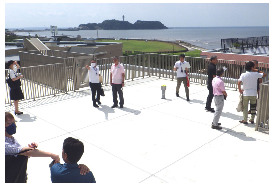
【市長視察の様子（屋上）】