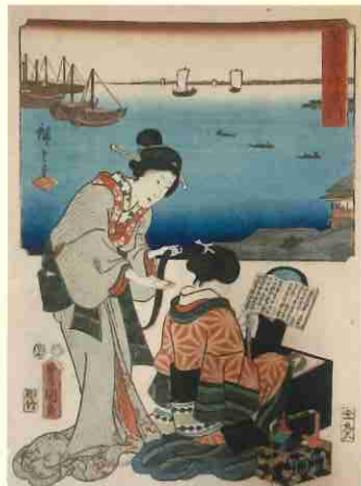
歌川国貞(三代豊国)、歌川広重「双筆五十三次品川」