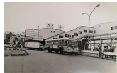
昭和50年代の長後駅

開催日：2024年1月21日（日） 時間：10時～12時30分頃 会場：長後公民館（集合）～長後駅（解散） 定員：25人（申込み先着順） 費用：無料 講師：元小田急電鉄駅員、藤沢市郷土歴史課学芸員 申込み：1月10日（水）9時から郷土歴史課まで電話・メールにて 申込み受付