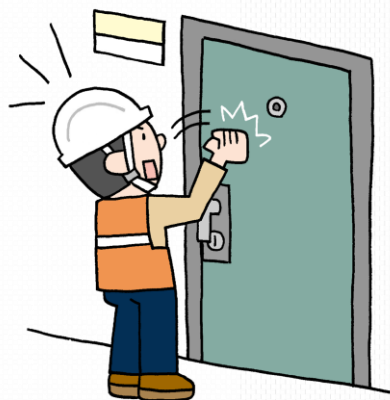
タオルの掲出がない場合

(近所の)皆さんで協力して、一軒一軒インターホンを鳴らしたり、ドアを叩いたり確認作業を行わなければなりません。