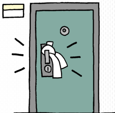
タオルの掲出がある場合