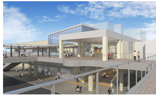
自由通路階（南口から望む）