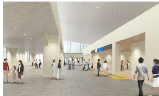
自由通路階（北口から望む）