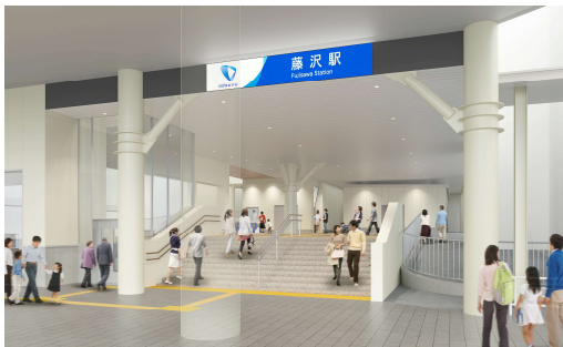
地上階（南口から望む）