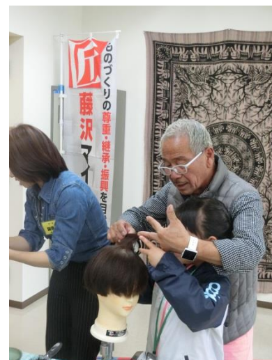
おしごと王国 (御所見公民館)