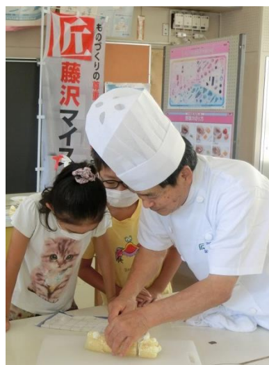
地産地消食育講座 (浜見小学校)