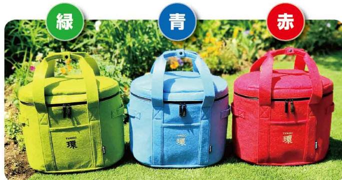
(幅 40cm × 奥行 28cm × 高さ 35cm) 1 個 3,000 円

※こんな方におすすめ…堆肥を家庭菜園に使いたい。また、コンポスター環で出来た堆肥は「たまきファーム」に持ち込むと「環の堆肥」で育てた野菜と交換できます。