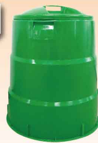
(幅 60cm × 高さ 66cm) 3,300 円