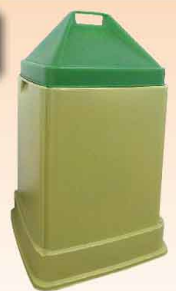
(幅 45cm × 高さ 70cm) 3,300 円