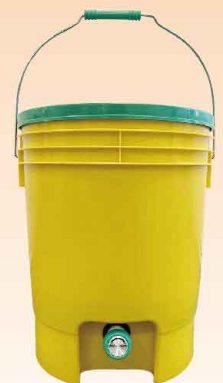
(幅 31cm × 高さ 39cm) 1,500 円