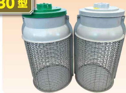
(幅 30cm × 高さ 55cm, 2 個 1 セット) 5,200 円