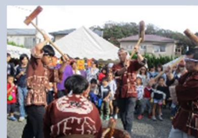
ふれあいまつりの様子

諏訪神社例大祭やふれあいまつり等の各催事にて唄の披露が行われました。また、会長と意見交換を行いました。