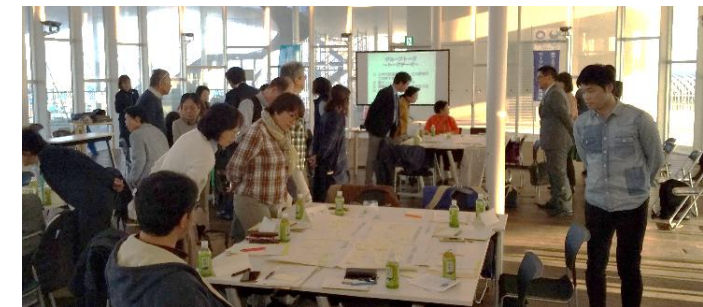
第1回地区集会の様子

本年度取り組んでまいりました各事業に次年度も取り組むとともに、地区集会でいただいたご意見をもとに、本会が取り組むべきと思われる地域課題がありましたら、検討を進めてまいりたいと思います。