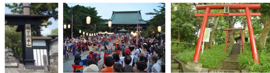
21 青銅製燈籠 27 遊行の盆 36 藤稲荷