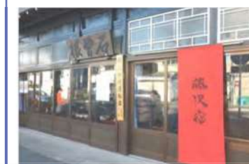
まちなみと調和した看板