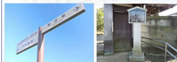
分かりやすいサイン