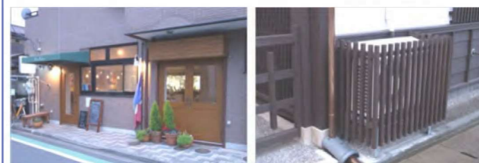
緑を置き、照明を工夫