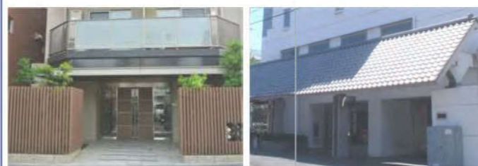
塀の素材、形態に配慮

建築物や外構の素材、形態を工夫することで、 周囲と調和したまとまりあるまちなみをつくります