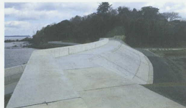
南三陸町 寺浜海岸(完成)