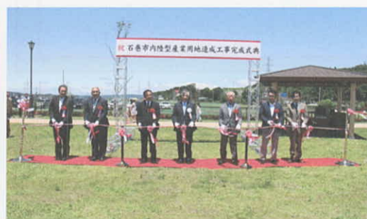
6月18日 須江地区内陸型産業用地の工事完了(石巻市)