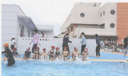
6月15日 荒浜小学校で6年ぶりのプール開き(巨野町)