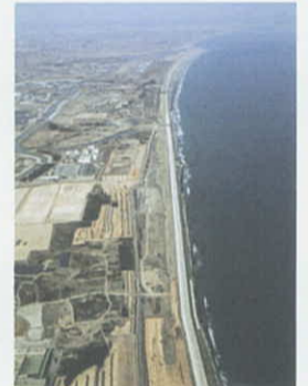
名取海岸・岩沼海岸(完成)