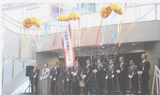
7月1日 仙台空港民営化(名取市)