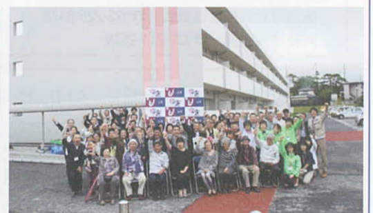
6月30日 清水沢地区入居式(塩竈市)