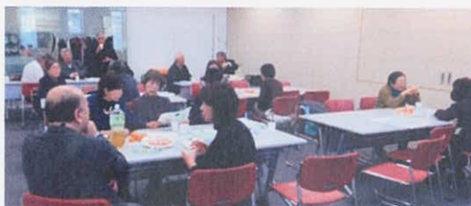
青葉区地域交流懇談会の様子

今後も他の地域交流も新たに加え、地域の社会福祉協議会などと連携しながら皆さまの暮らしがよりよくなりますよう、地域交流懇談会の開催計画をたててまいります。