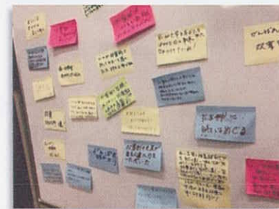
“双葉町へのメッセージ”

午後は1時半から「東日本大震災から6年・・・避難者を取り巻く環境と今」と題してシンポジウムを開催しました。