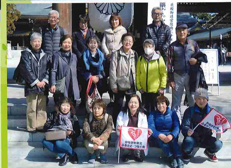
神門前で記念撮影 天気が良すぎて眩しそう〜