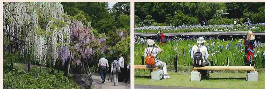
「ふじまつり」と「花しょうぶまつり」の様子 (写真提供：横須賀しょうぶ園)

今はシャクナゲが見ごろ。赤い花が見事でした。花菖蒲はまだ葉が30cmほど伸びたところ、藤棚の花は咲き始めたところでした。藤はこの広報誌がお手元に届いたところ見ごろかと思えます。花しょうぶまつりは6月1日から一か月間開催されますが、今年は少し早めにお出かけになるといいかな、と思えます。いろいろな種類の花々が次々に咲いて、いつの季節でも訪れる価値がある公園だと思います。(5月～8月は午前9時～午後7時まで開園) (報告・写真：KN)