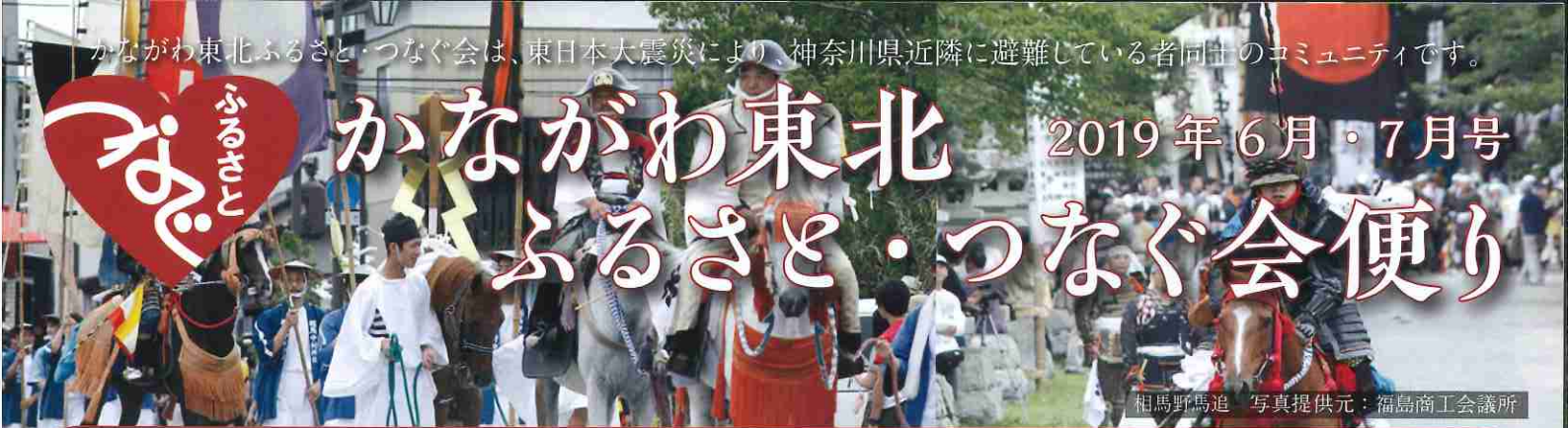
相馬野馬追

みなさまいかがお過ごしでしょうか？ 梅雨が明けたら暑さとともに少しずつ夏のお祭りも始まりますね。