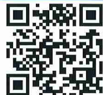
宛先アドレスのQRコード

お申し込み内容確認のため、返信させていただくことがあります。迷惑メールフィルターご利用の場合、当アドレスが受信できるよう設定をお願いいたします。