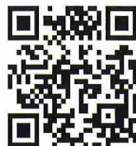
宛先アドレスのQRコード

お申し込み内容確認のため、返信させていただくことがあります。迷惑メールフィルターご利用の場合、当アドレスが受信できるよう設定をお願いいたします。