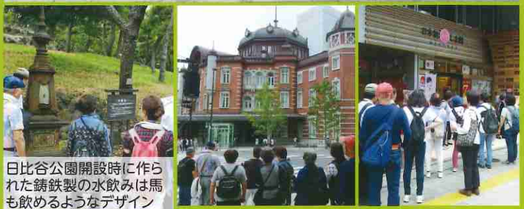
日比谷公園開設時に作られた鑄鉄製の水飲みは馬も飲めるようなデザイン

9月14日の散歩は日比谷公園、皇居からMIDETTEまで歩きました。快適な気温の中26人の方が参加。観光客が多く訪れていた二重橋前で記念写真をパチリ！馬場先門、明治生命館、三菱一号館の中庭からKITTE内を通り抜けて東京駅丸の内口の赤レンガの距離はかなり長い！そして呉服橋から日銀本店前、ヴェネツィアの大理石を使っている三井本館、三越前を経由して、ゴールの日本橋ふくしま館MIDETTEで解散。それぞれに福島の旨いものを買ったり酒の試飲をしたり、疲れも忘れて店内は賑やかでした。見ごたえのある重文の建物が多く少しは目の保養にもなったのかと思われます。（報告：T.T.）