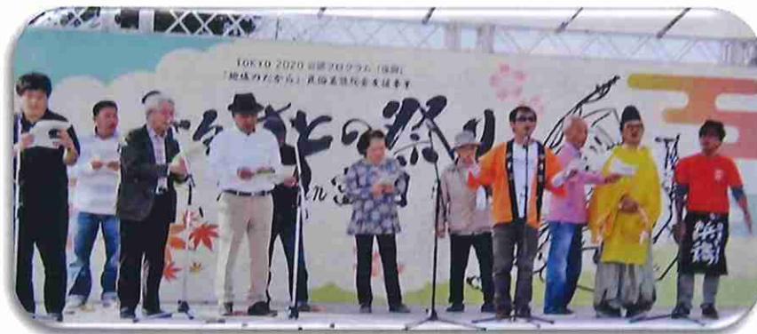
広報 とみおかNo.674より