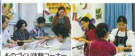
ものづくり体験コーナー 水引きアクセサリー