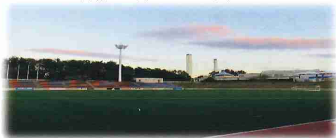
宿泊先の「ヴィレッジ」

今年も富岡90有余年の伝統文化、五穀豊穰と商売繁盛を願う「えびす講市」が開催されます。首都圏にお住まいのみなさまと一緒に参加して、ふるさとの仲間と語り・歌い交流しませんか。今回は『福島を歌おう』と題し、小・中学校校歌を歌うことにしています。みなさまのご参加をお待ちしています。