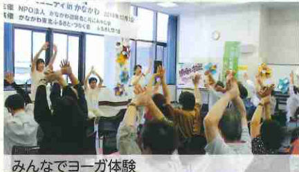
みんなでヨーガ体験