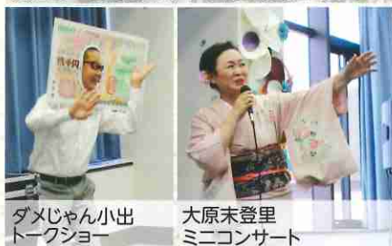
ダメじゃん小出 トークショー