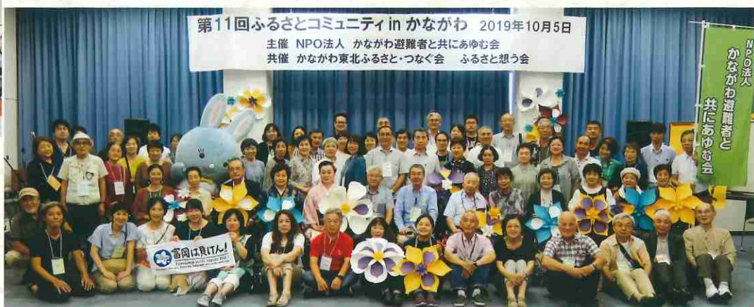
第11回ふるさとコミュニティ in かながわ 2019年10月5日