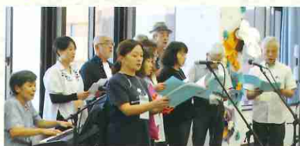
浪江町・富岡町の小中学校の校歌を歌おう