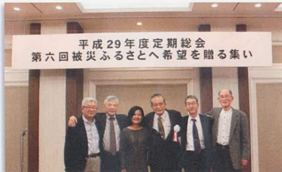
あゆむ会スタッフと

私たちと共に歩まれた方々もそれぞれのお考えでふるさとや新しい土地への別れて行きました。悔いのない人生を歩まれることを祈ります。