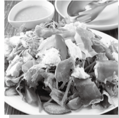
八百屋さんのDining Bar LINK