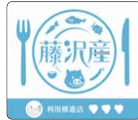
このマークが目印

藤沢産の農水産物や加工品などを積極的に利用する小売店・飲食店・宿泊施設・移動販売店・海の家などを「藤沢産利用推進店」として認定しています。藤沢産利用推進店は、6月30日時点で96店舗が登録されています。扱っている食材は、野菜・果物・肉・魚とさまざまで、各店舗によって多彩な味を楽しむことができます。