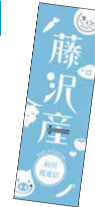
のぼり旗もあります

藤沢産の農水産物や加工品などを積極的に利用する小売店・飲食店・宿泊施設・移動販売店・海の家などを「藤沢産利用推進店」として認定しています。藤沢産利用推進店は、6月30日時点で96店舗が登録されています。扱っている食材は、野菜・果物・肉・魚とさまざまで、各店舗によって多彩な味を楽しむことができます。