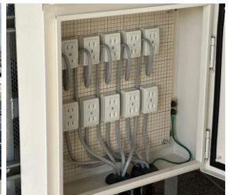
非常時コンセント