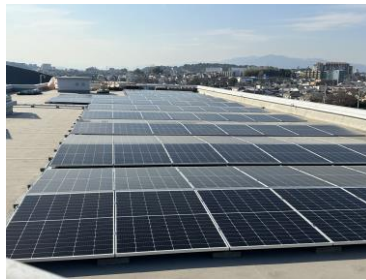
第一中学校屋上設置

平常時は太陽光から得られた電力を施設に供給し、余剰電力は蓄電池に蓄え非常時の電源として活用します。