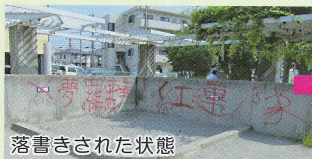
落書きされた状態