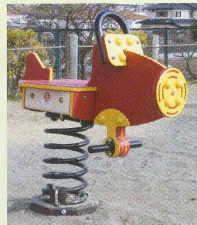
平成25年度 小塚(鶴巻)公園改修予想図