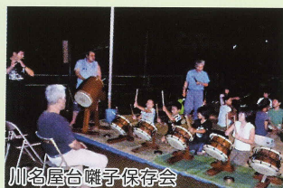
川名屋台囃子保存会