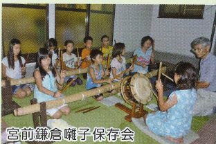
宮前鎌倉囃子保存会