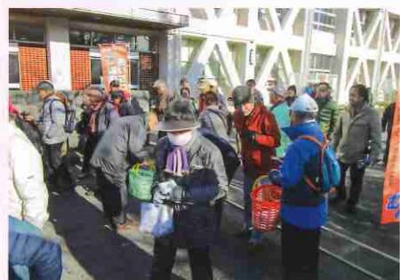
▲元旦歩行大会での活動