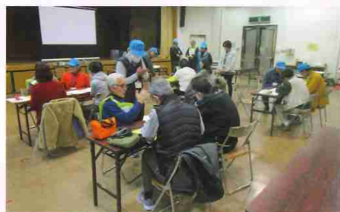
▲災害ボランティアコーディネーター養成講座

災害時、被災者と災害ボランティアの仲介役となる、災害ボランティアコーディネーターの養成講座を毎年開催していますが、残念ながら今年度は中止となりました。来年度の早い時期に改めて開催できるよう検討していきます。