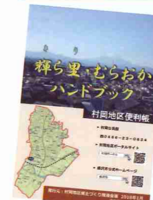
▲輝ら里・むらおかハンドブック

初版発行から3年近くとなり、人口などのデータ、各種施設や諸団体の名称や構成、医療機関等の変動に伴い、記載情報の更新が必要になっていました。実情に合わせた内容にするため、部分的改訂を行いました。