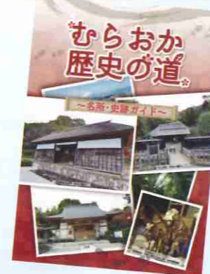
◀むらおか歴史の道

歴史ガイドマップ「むらおか歴史の道」をご好評に応じて増刷し、藤沢市観光協会、藤沢宿交流館、湘南藤沢コンシェルジュ(藤沢駅)、村岡公民館で配布しています。