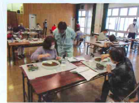
▲苔テラリウム講習会

毎年花やリースの寄せ植え講習会を実施しています。今年は「苔テラリウム」を実施しました。おもて面にて開催の状況を詳しくお伝えしています。