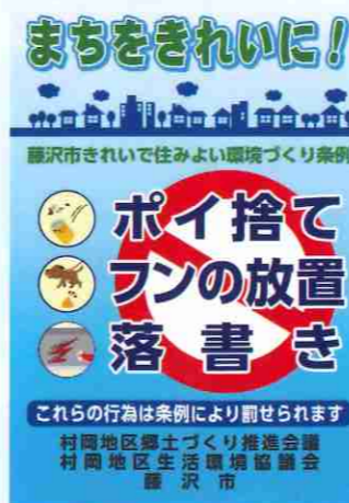
▲マナーアップ啓発看板

昨年に引き続き、今年も看板を作製して地区の自治会や企業に掲示の協力をお願いし、ごみやタバコのポイ捨て禁止を呼びかけていきます。