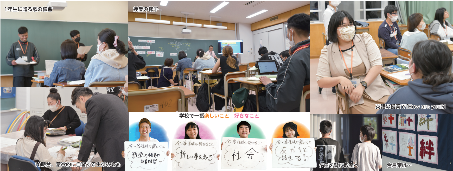
1年生に贈る歌の練習