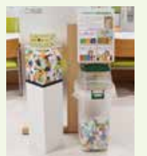
キャップ回収ボックス

ペットボトルキャップ860個が1人分のポリオワクチンとなり、世界中の子どもたちに届けられます。中央支店では回収ボックスを設置しています。キャップは水洗いをして乾かしたものをお持ちください。