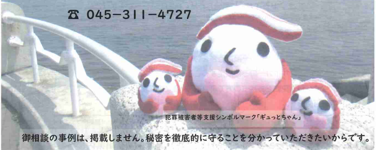
犯罪被害者等支援シンボルマーク「ギョっとちゃん」

御相談の事例は、掲載しません。秘密を徹底的に守ることを分かっていたいただきたいからです。