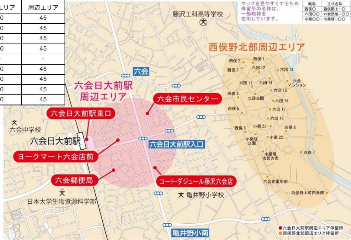
図1 実証運行の運行エリア、運行時刻表