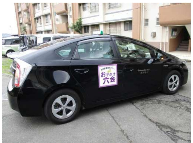
図 4 使用車両