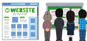
②パブリックコメントの募集 (住民) (利用者) (利害関係者)