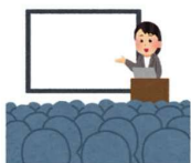
①公聴会の開催 (住民) (利用者) (利害関係者)

運送する路線等にかかる住民、利用者、利害関係者へ広く意見を求める手法としては、法令上、公聴会の開催は例示であり、以下の方法などが想定される。