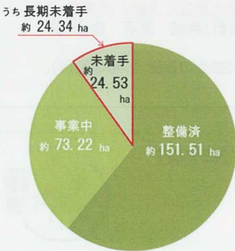
図 - 都市計画公園・緑地の整備状況