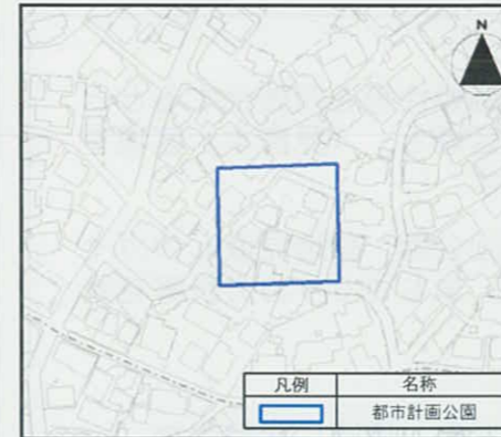
図 - 財政事情に関する主な事例

※1箇所の都市計画公園・緑地において、長期未着手の原因が複数存在するケースがあります。