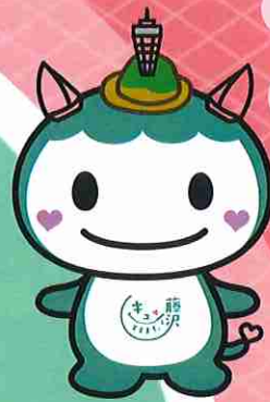
「キュンとするまち。藤沢」 公式マスコットキャラクター ふじキュン♡