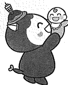
救命講習Ⅲ 乳児・幼児に対 する応急手当