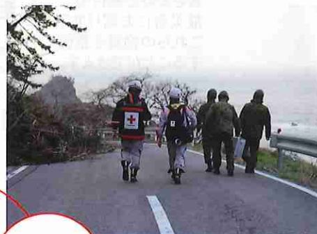
▲寸断された道路を自衛隊員と進む同救護班(石川県珠洲市)